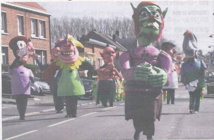
Fête foraine, brocante, feu d'artifice, cortège... Le week-end sera riche en émotions.