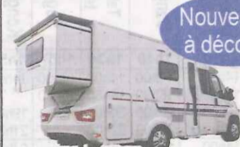
Compact SCS Adria