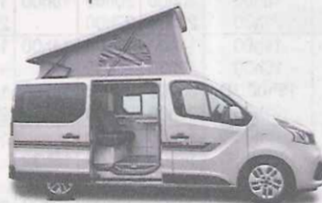
Renault Traffic Adria Active