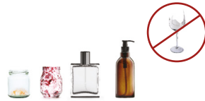
Pots, bocaux et flacons en verre