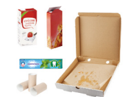
Emballages en carton