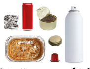
Emballages en métal et les petits aluminiums