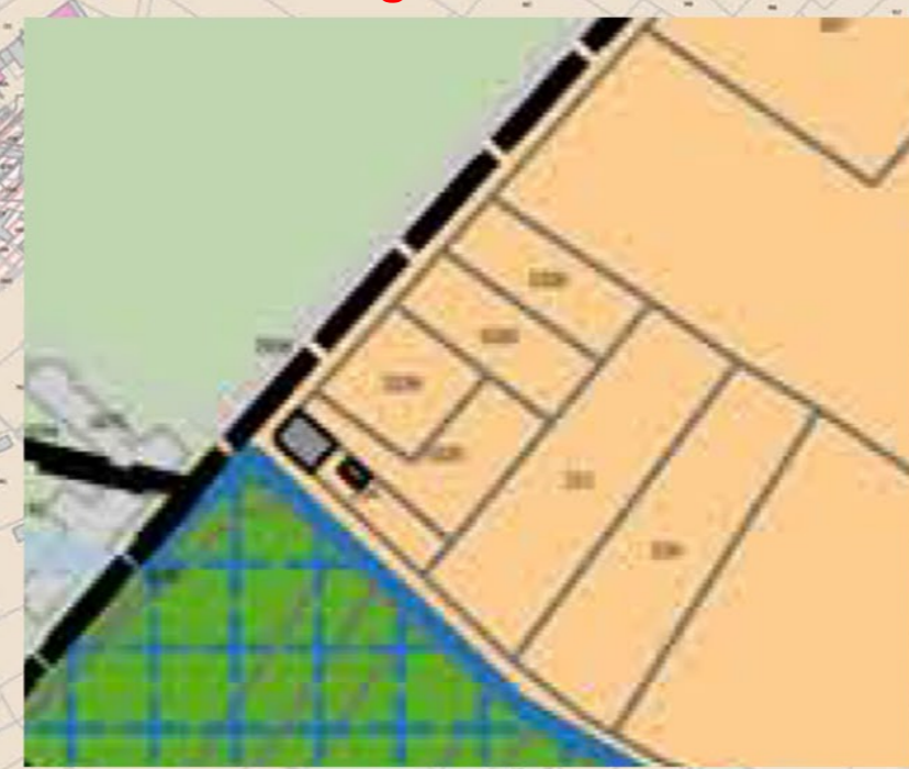
Extrait de zonage avant modification