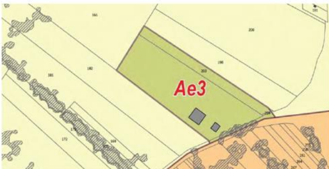
Correction envisagée dans le cadre de la révision allégée n°3 du PLUi - Commune de Villers-Pol