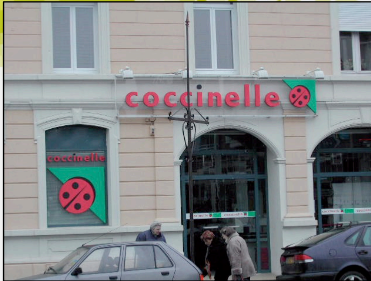
Bonne intégration & mise en valeur du patrimoine