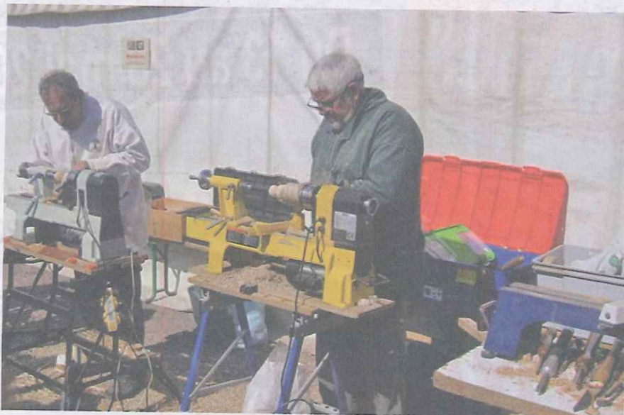
Un concours de tournage sur bois sera organisé.

2 rencontrer les artisans De 10 h à 18 h 30, les artisans, ils seront une cinquantaine, vont envahir les rues du village et travailler le bois sous vos yeux. Vous pourrez assister à de nombreuses démonstrations mais aussi participer à des initiations. Découvrez également les métiers de demain, métiers de la construction bois, des nouveaux modes de chauffage, ou encore les sports, comme la canne de combat, dont le bâton est fabriqué en châtaignier. Il y aura